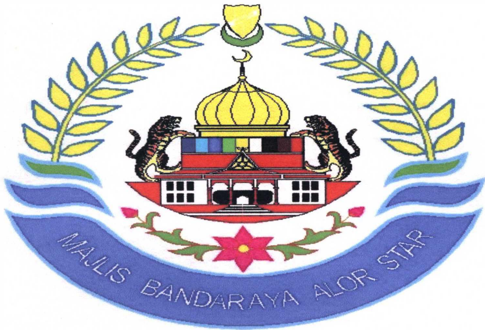
LOGO MAJLIS BANDARAYA ALOR STAR