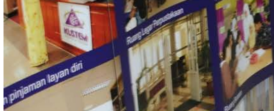
pinjaman layan diri