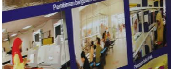
Ruang Lagar Perpustakaan