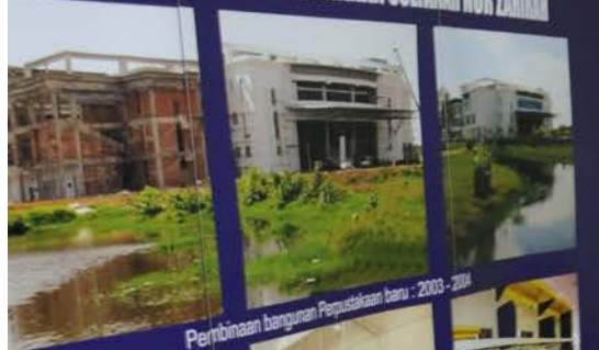
Pembinaan bangunan Perpustakaan baru : 2003 - 2004