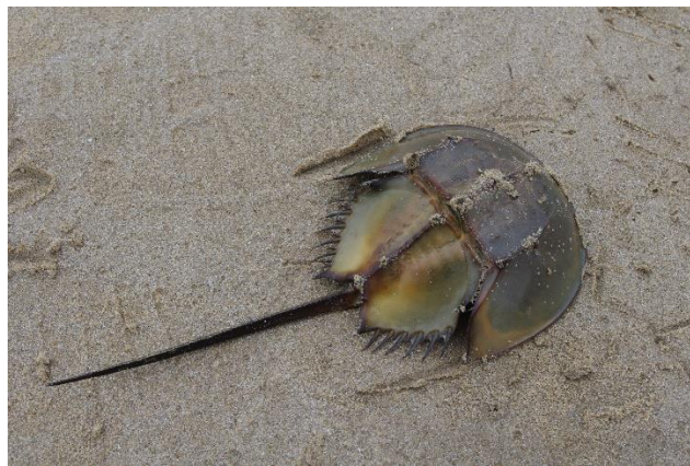
Figure 1 Rajah 1

Rajah 1 menunjukkan satu spesies belangkas tiga duri, Tachypleus tridentatus .